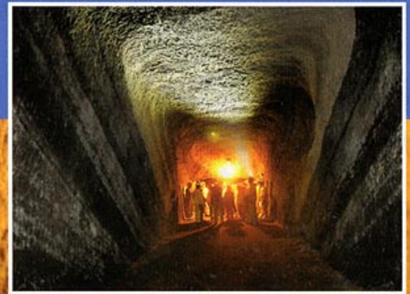
壕内の照明は太陽光発電を利用しています

みなさん、赤山地下壕跡へようこそ。今から地下壕の探検が始まります。 赤山地下壕跡は、館山市の歴史だけではなく、土地のおいたちも教えてください。 房総半島南部の丘陵は、新生代第三紀という比較的新しい年代(とはいっても、およそ2,400万年前より新しい地層ですが。)の凝灰岩質の砂岩や泥岩など、やわらかい地層が重なりあい形成されています。 壕の中で、次の3つのポイントをもとに観察してみてください。