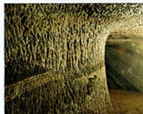
写真4 / 地層のずれを観察できる