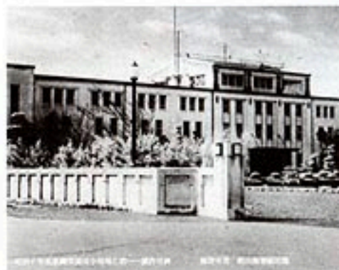
写真1 / 旧館山海軍航空隊司令部。写真2のように今でも立派に使われている

そして、1930（昭和5）年、海軍5番目の実戦航空部隊として、館山海軍航空隊がつけられました。それから、1945（昭和20）年の終戦までの間、館山市香から沼にかけての1帯には、航空機の修理、部品の補給などをおこなった第2海軍航空廠館山補給工場、食糧・衣服・燃料などを補給した横須賀軍需部館山支庫関係の施設など、さまざまな軍事施設がつけられました。旧館山海軍航空隊の基地（写真1）は、現在、海上自衛隊館山航空基地（写真2）として使われています。