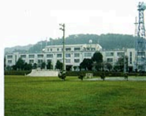
写真2 / 海上自衛隊館山航空基地司令部。後ろの山が、地下壕跡が残る赤山